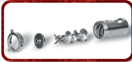
Removable Head Unit