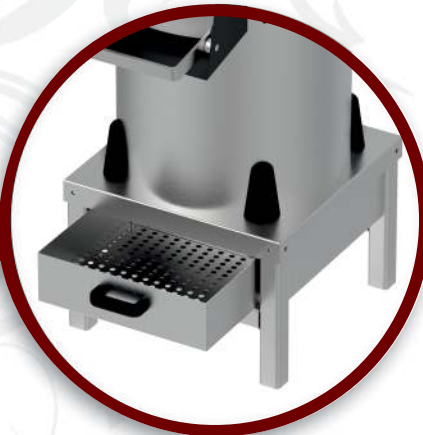
Filtre | Filter