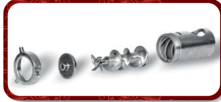
Removable Head Unit