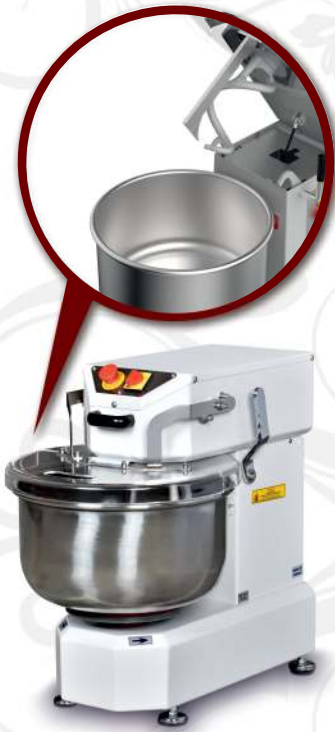
BSH.20 Kalkar Kafa